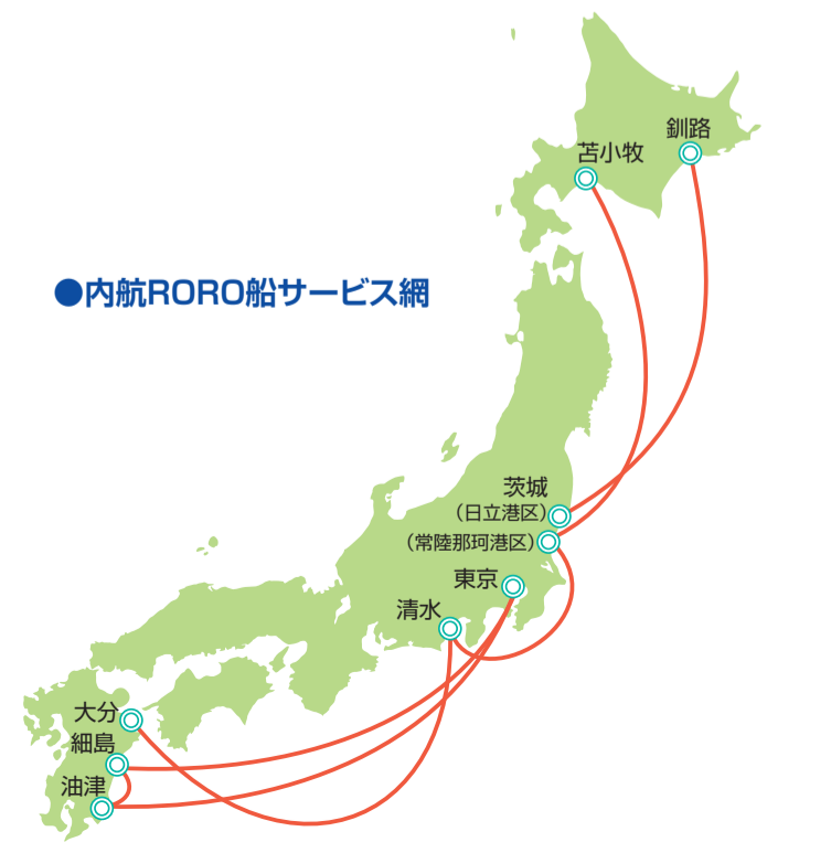
●内航RORO船サービス網